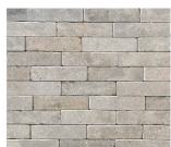
Brique de réemploi