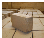
Brique en terre crue