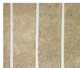
Béton de chanvre