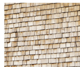
Tavillons en châtaignier