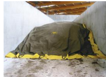
Broyage puis maturation