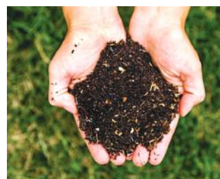
Compost de qualité (agriculture)

532 : Nombre de tonnes de biodéchets et déchets verts collectés en 2016 (soit 35kg / habitant). C'est 70 tonnes de plus qu'en 2015 !