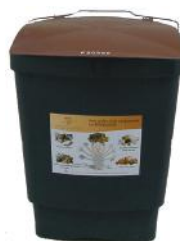
Bacs de collecte (sacs biodégradables) et/ou sacs réutilisables

*En cas de grosses quantités, déposez vos sacs directement en déchetterie.